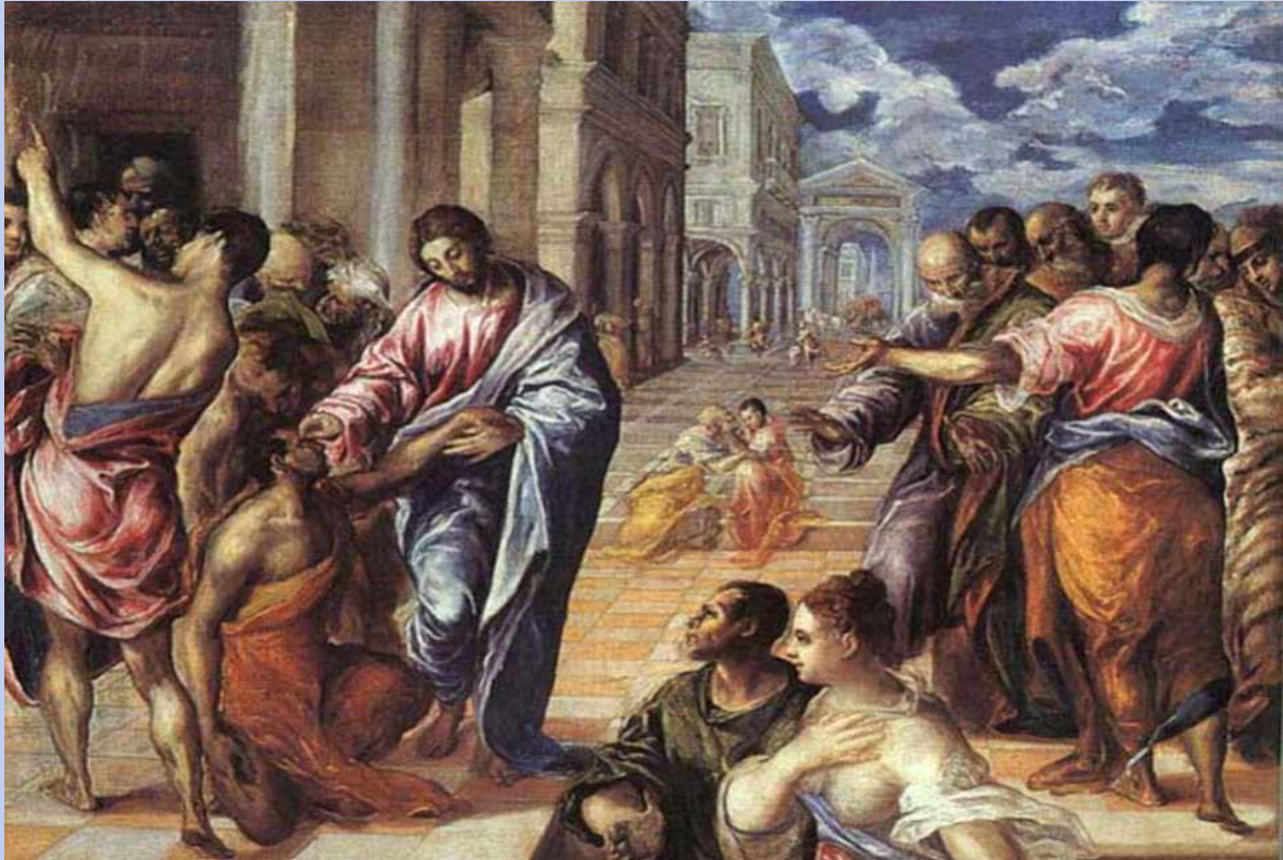
<맹인을 치료하는 예수 1575년, 엘 그레코>