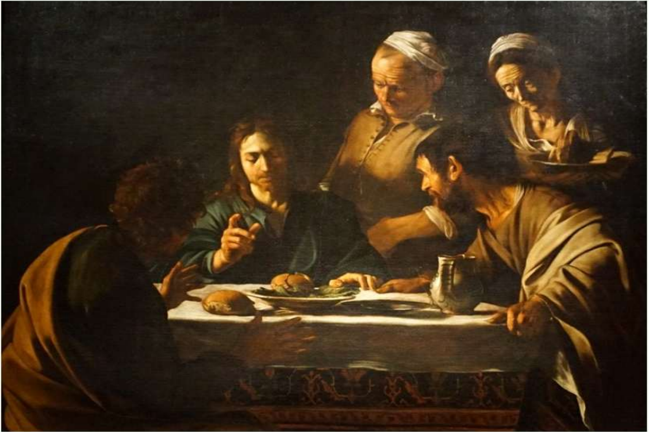
“엠마오에서의 저녁식사” 1606년경 카라바조