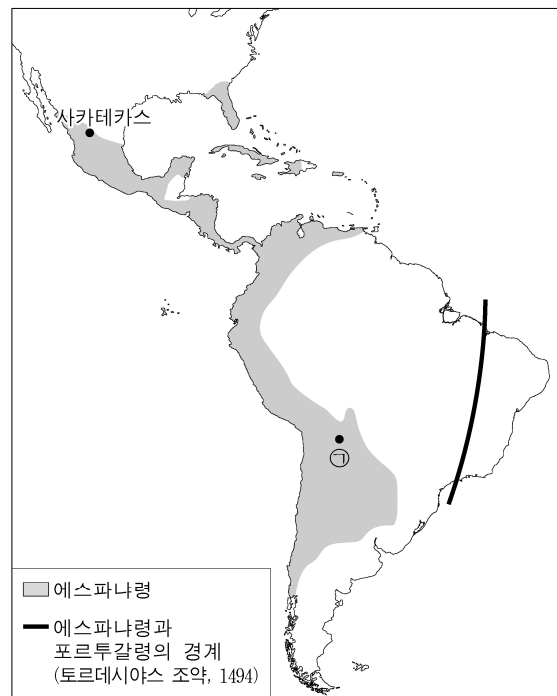
<1600년 경 에스파냐령 아메리카>

(나) 1540년대에 멕시코의 사카테카스와 볼리비아의 (㉠)에서 엄청난 매장량을 가진 은광이 발견되었고 은의 채굴에는 원주민 노동력이 대거 투입되었다. 16세기에 ㉡ 에스파냐로 유입된 대량의 은은 유럽과 아시아 사이의 교역을 더욱 촉진하는 매개체가 되었다.